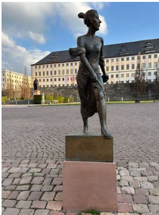
Herzogin Luise Dorothea – Denkmal in Gotha